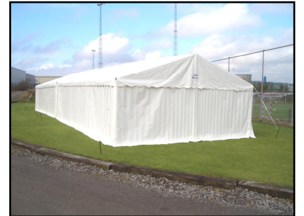
Un piquet d'ancrage à chaque pied (Les piquets peuvent aussi servir à haubaner la tente)